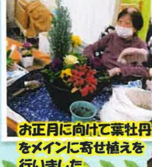
お正月に向けて葉牡丹をメインに寄せ植えを行いました。