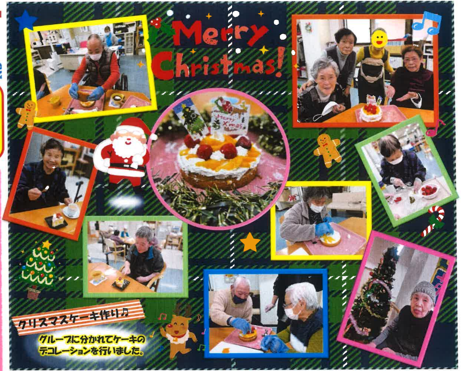
クリスマスケーキ作り♪ グループに分かれてケーキのデコレーションを行いました。